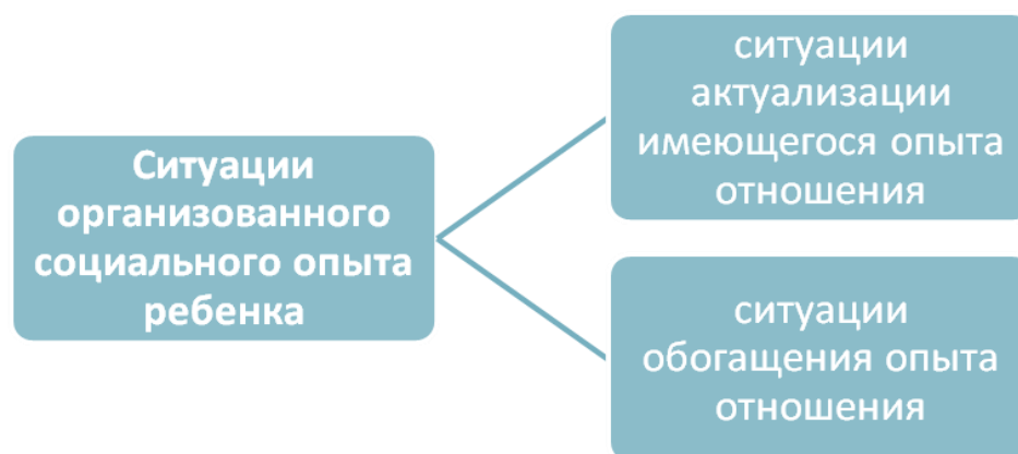
Рис. 3. Виды ситуаций организованного социального опыта.

Большим потенциалом для накопления опыта является личный опыт свершения поступков, подтверждающих ценностное отношение к ЗОЖ. В воспитании для организации такой работы используют ситуации организованного социального опыта – метод предложенный Н.Ф.Головановой [8]. Эти ситуации условно разделяют на два типа (рис.3), но в реальности они часто переплетаются.