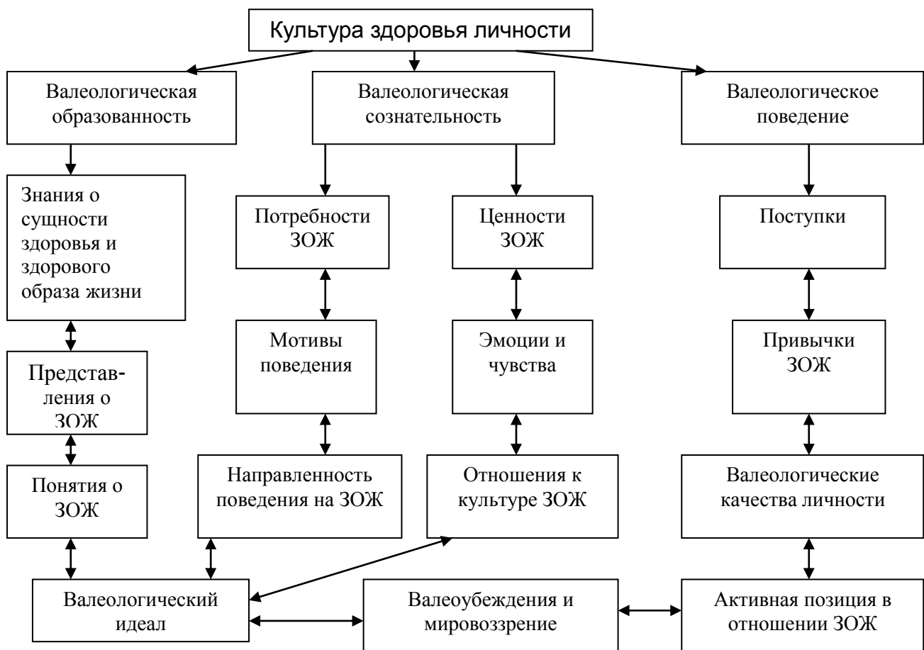
Рис. 1. Структура культуры здоровья личности (по А.М.Митяевой [4]).

В основу нашей экспериментальной работы легло следующее понятие: «Культура – исторически определенный уровень общества, творческих сил и способностей человека, выраженный в типах и формах организации жизни и деятельности людей» (Википедия). Человек в сфере культуры осуществляет деятельность в трех аспектах: познает (потребляет) культуру, действует в общественной среде как носитель определенных культурных ценностей и создает новые ценности, которые становятся базой для развития культуры следующих поколений.